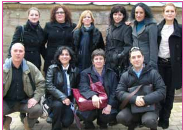
Од отворањето на центрите

Центарот во Штип ја координира работата на сите четири центри, кои ќе останат отворени во следните две години. Невладините активисти во центрите пополнуваат унифицирани обрасци за секоја поплака од граѓаните, без разлика дали тие дошле лично во канцеларијата, се јавиле на некој од телефоните за поплаки или ја доставиле поплаката на електронската адреса. Ваквите обрасци потоа се анализираат и се класифицираат, што овозможува да се има редовна слика за случувањата во локалната самоуправа, за прашањата за кои граѓаните